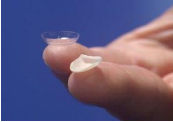
صورة ١: اللومينر مقارنة بالفينير