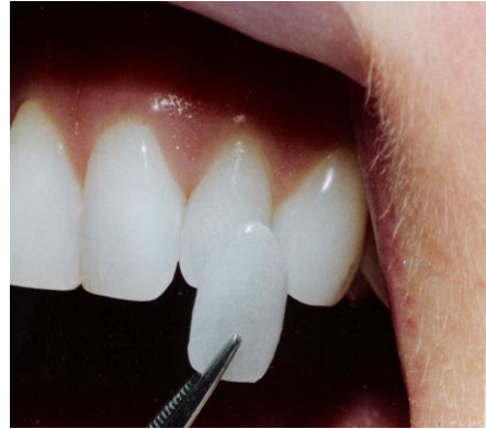
صورة ٢: الفينير أثناء وضعها