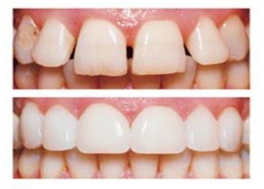
صورة ٦ : للأسنان قبل وبعد العلاج بالقشرة الخزفية