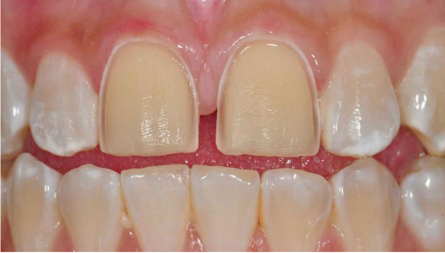
صورة ٥ : للأسنان بعد البرد وقبل تركيب القشرة